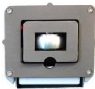
Sonda de medição (Aluminum R ring, model AL-R1)